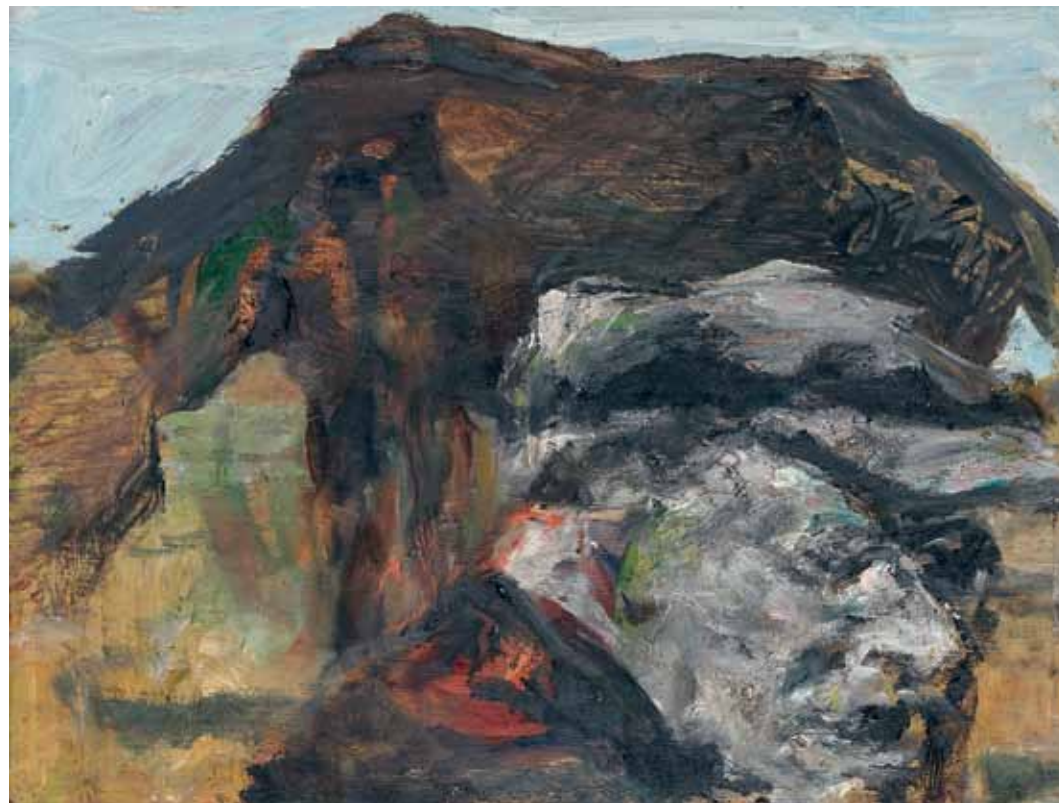
rechts ‘Isaak Babel’, 2011, olieverf op hout, 30 x 40 cm