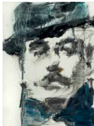
boven 'Giacomo Puccini', 2012, olieverf op doek, 40 x 30 cm Naar het einde toe worden de reeks van portretten bijna zwart-wit. Het is een versoering die de intensiteit verhoogt.