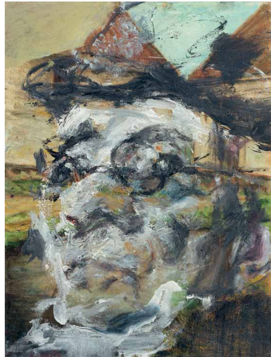
links ‘Paul Léautaud’, 2011, olieverf op doek, 40 x 30 cm Is de gigantische portretgalerij met beroemde en minder beroemde personen van de oudheid tot vandaag ook een soort zelfportret?

Of u van zijn vroegere schilderijen houdt of niet: ‘Authors’ doet iedereen versteld staan. Niet zozeer omwille van de overdonderende hoeveelheid, maar omdat er een versobering aan de gang is die de intensiteit een opstoot geeft. De ingetogen parade van portretten is ontsproten uit een grote liefde voor schrijvers die er al was. De kunstenaar maakt me erop attent dat het geen bewuste keuze is. In zijn werk gebeurt alles op natuurlijke wijze, ongeforceerd. Anders dan anders krijgt de toeschouwer een gigantische inhoud aangereikt. Door te kijken naar de hoofden van Plato, Seneca, Pirandello, Bukowski, Jack Kerouac, Philip Roth, Chateaubriand, impressionistische kunstenaars zoals Rodin en Degas, Charlie Chaplin, de Dikke en de Dunne waar hij een fan van is, Mozart, Bach, Puccini, Jacques Brel en meer beroemde en minder beroemde personen komt automatisch ook alles wat zij verwezenlijkt hebben aangewaaid. Het is een duik in de draaikolk van de beschaving, de geschiedenis die het heden en de toekomst kneedt.