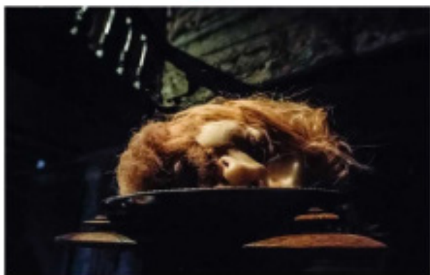
Hoofd van Johannes de Doper op een schaal, een verwijzing naar het Salome-verhaal.

Overdaad, verval, barokke extravaganza: decadentie is troef in de voorjaartentoonstelling in het kasteel van Gaasbeek. Theatermaker Stef Lernous (Abattoir Fermé) tekende een speels parcours uit.